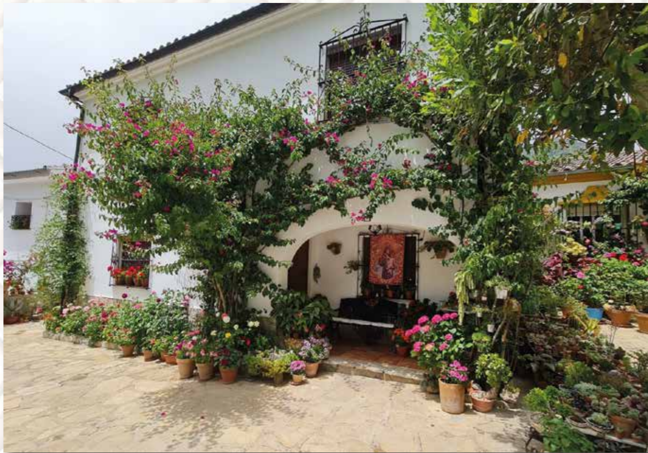
PRIMER PREMIO Isabel Jarillo Calvillo