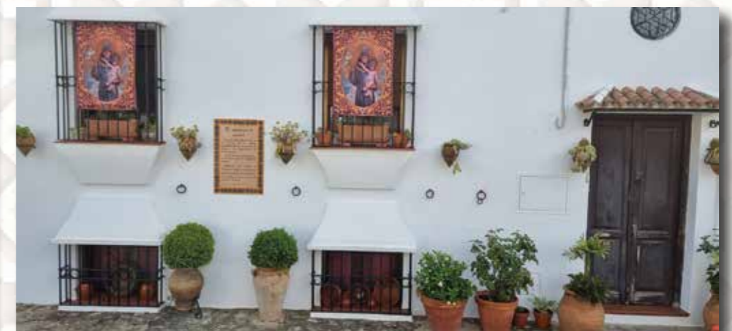
Honoría Jarillo Calvillo